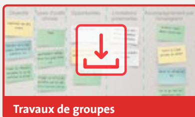
Travaux de groupes