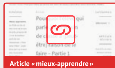
Article « mieux-apprendre »