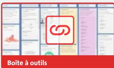
Boîte à outils