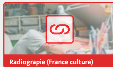
Radiographie (France culture)