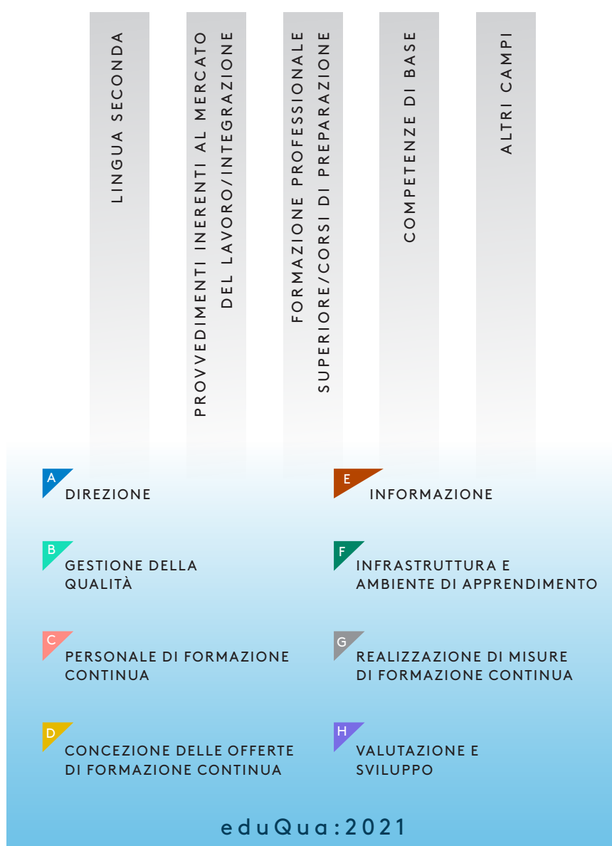
Fig. 5: Permeabilità - eduQua:2021 come standard di base

Requisiti di base per l'istituto di formazione continua e le sue offerte