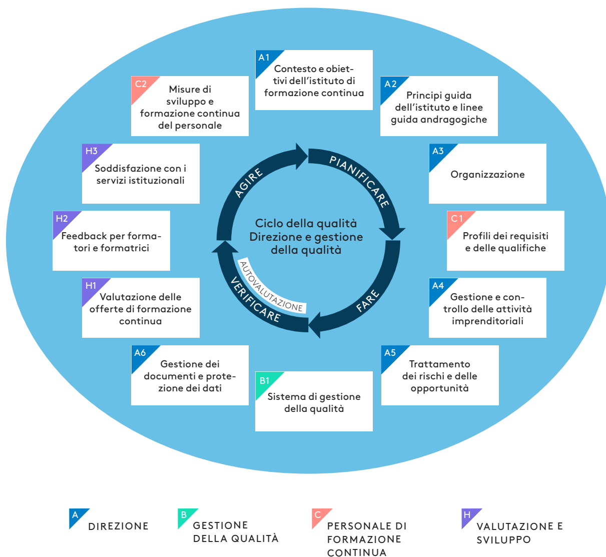
Fig.3: Ciclo di controllo della qualità direzione e gestione della qualità