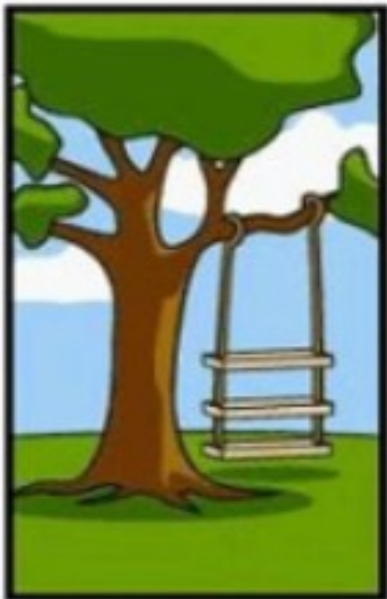
Comment le client a exprimé son besoin