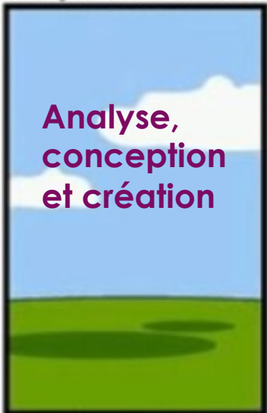
Comment le projet a été documenté