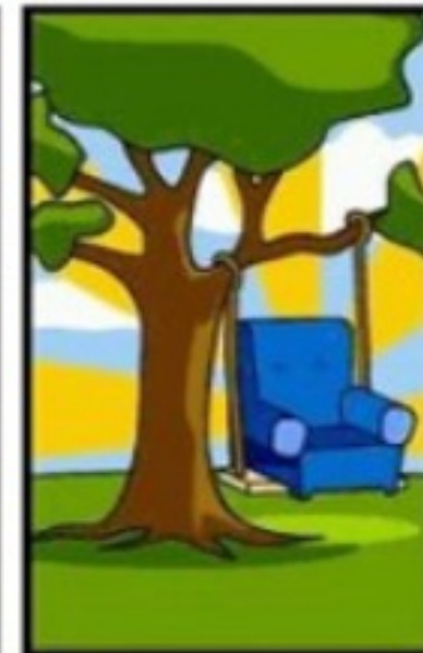
Comment le responsable des ventes l'a décrit