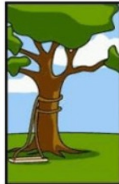
Comment le programmeur l'a écrit