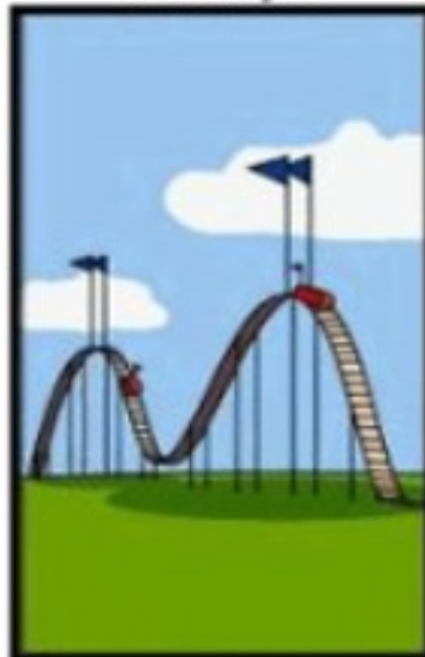
Comment le client a été facturé