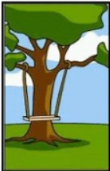
Comment le chef de projet l'a compris