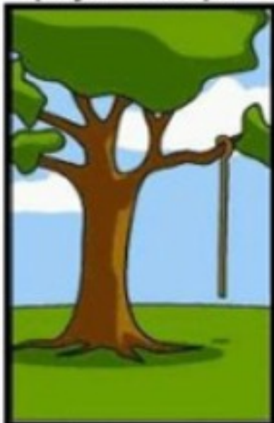
Ce qui a finalement été installé