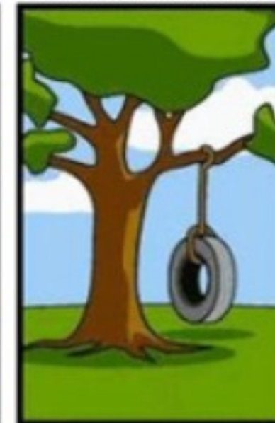
Ce dont le client avait réellement besoin