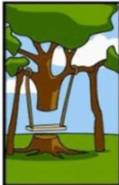
Comment l'ingénieur l'a conçu